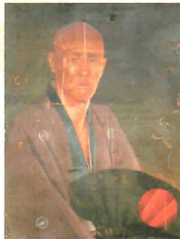
▲浅草宇一郎像 長楽寺所蔵