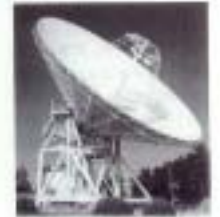
●図 5.4 VLBI 用 34m アンテナ