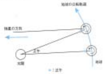
●図 5.1 電波の到来観測