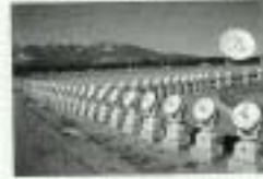
●図 5.3 電波の波長とアンテナの長さの関係